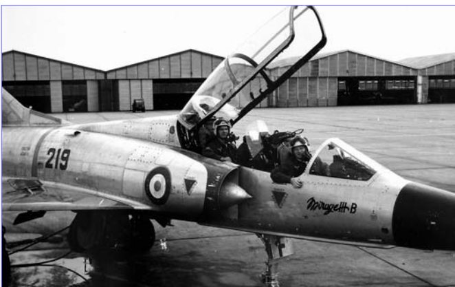
Ready to go in the Mirage IIIB 219