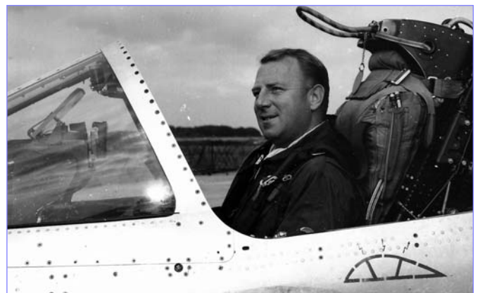
Sitting in a Mirage IIIB